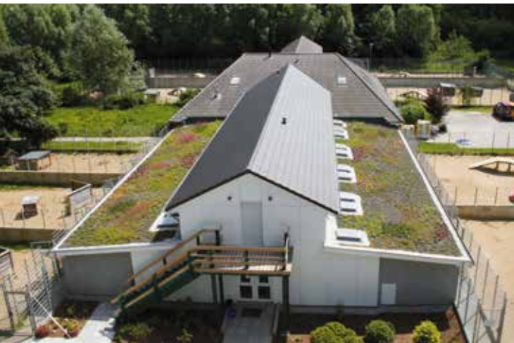
Erbschaften, Stiftungen und Spenden ermöglichten den Bau des 2013 fertiggestellten Tierschutzhauses.