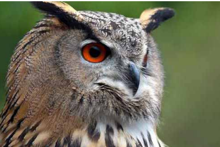
Erbschaften, Stiftungen und Spenden ermöglichten den Bau der 2019 fertiggestellten Wildtierstation.